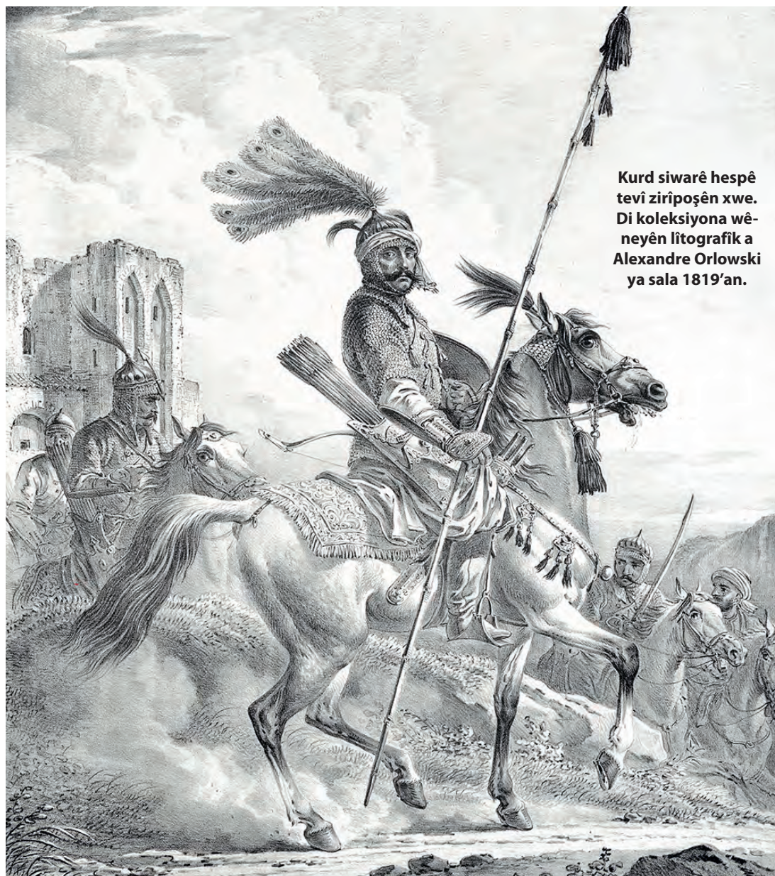
Kurd siwarê hespê tevî zirîpoşên xwe. Di koleksiyona wêneyên litografîk a Alexandre Orlovski ya sala 1819'an.

Sînor pêşî mêvandarî ye. Yanî ne jihevqutkirina eşîran (ên Kurd û Erebb) e, lê mekanê li gorî qaîdeyên eşîrî, adet û exlaqê civakî pêrgîhevhatin û têkiliyan e. Erê rast e ku mezinê Gêsan biryara rakirina terş û talanê Dodikiyan didin û wan çav berdaya Leylika Qemer yanî mehîna Ehmedê Şeng jî, lê ew li gorî adetên, bi mêvandariya Dodikiyên Kurd tîne hewandin. Çaxê ku 150 siwarên Gêsan ên Erebb dikeve erd û eqarên Dodikiyan, ew li bin konê mezinê eşîrê Ehmedê Şeng dihêwirin. Tevî ku Ehmedê Şeng ne li mal e jî, Xatûnê, hevîna wî xizmeta wan dike: Ew hespên wan ditewilîne, doşek û balgeh