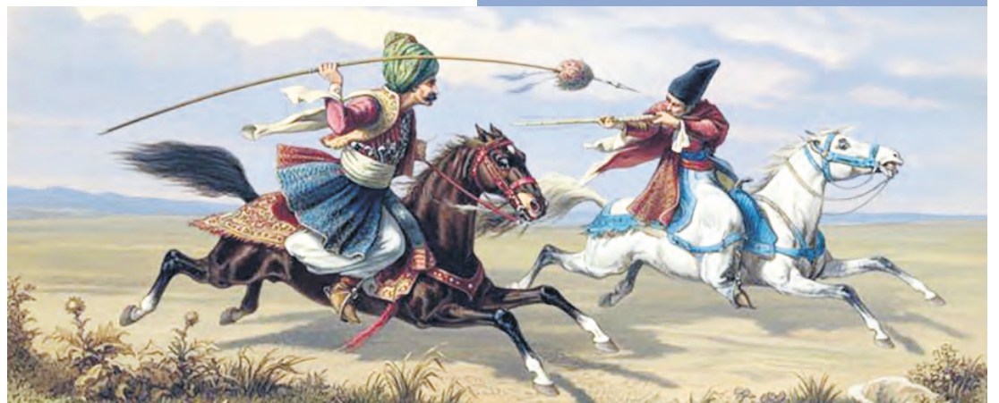
Sîwarê Kurd ji kitêba 'Illustrated Travels' ya H.W. Bates a sala 1875'an li Londonê hatî weşandin.

Li vir, bi nimûneya vê helbestê Barth esas balê dibe ser wê yekê ku sînor tiştêkî bi temamî elaqedarî mirovan e û weke têgehê avakirin. Em bi xêra vê, dikarin li fikra wî ya 1969'an jî vegehin. Beriya Barth, qewm