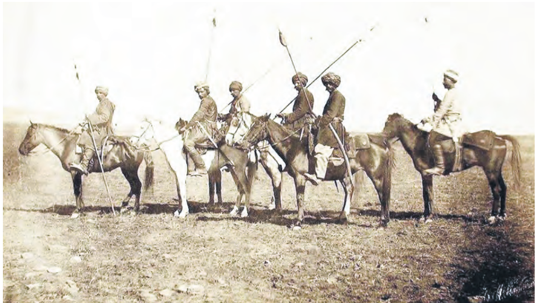
Suwarên Kurd di dema şerê Rûs-Osmanî di salên 1877-1878 de.